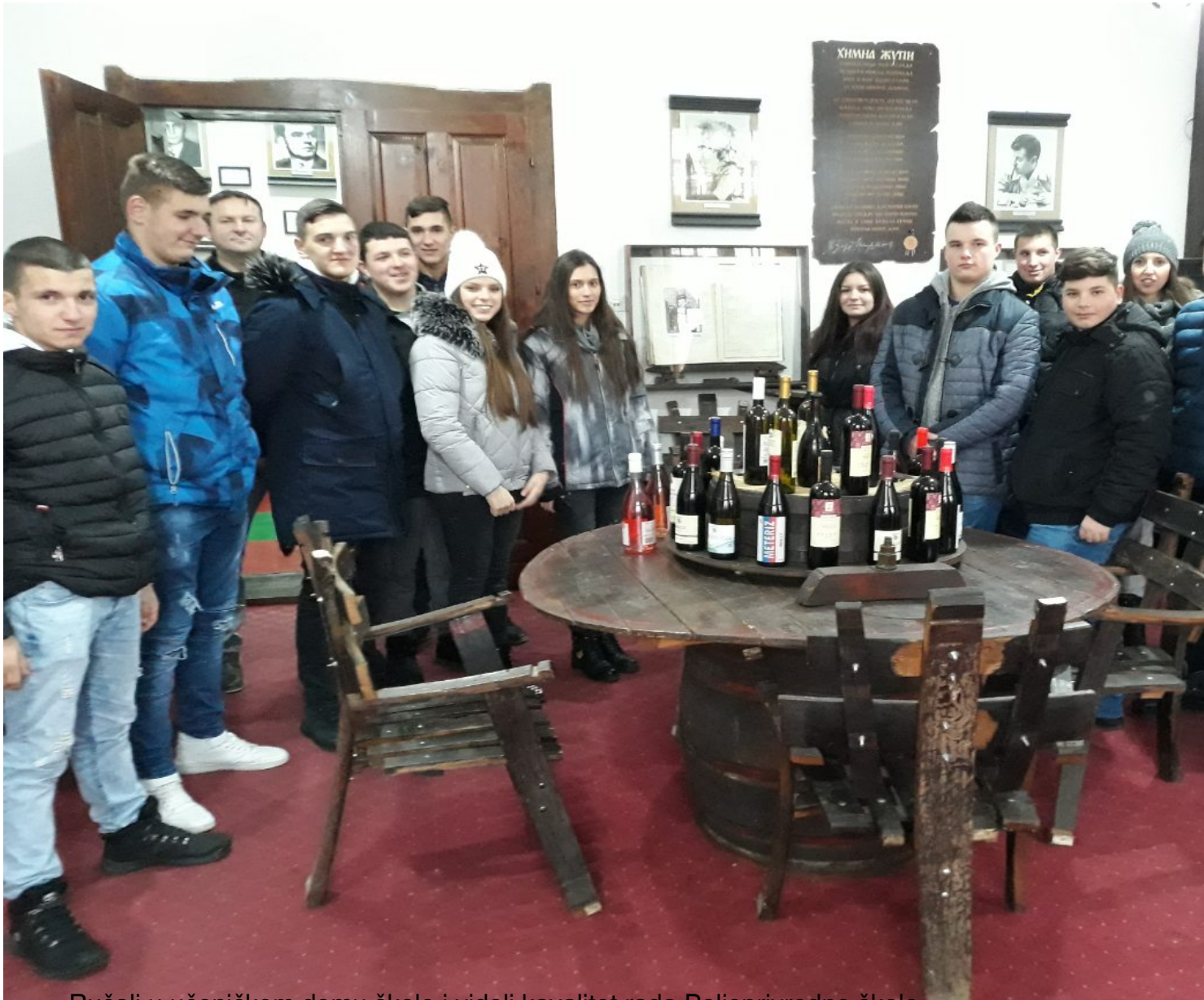
- Ručali u učeničkom domu škole i videli kavalitet rada Poljoprivredne škole